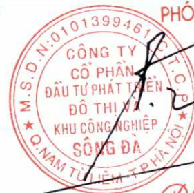
Trần Việt Dũng